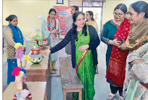
बहादुरगढ़। प्रदर्शनी में छात्राओं द्वारा तैयार उत्पाद देखती प्रिंसिपल व अन्य।