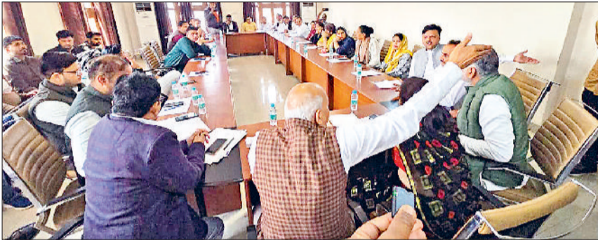
झज्जर। झज्जर। नप हाउस की बैठक में बहस करते हुए नप चेयरमैन और वाईस चेयरमैन प्रतिनिधि।