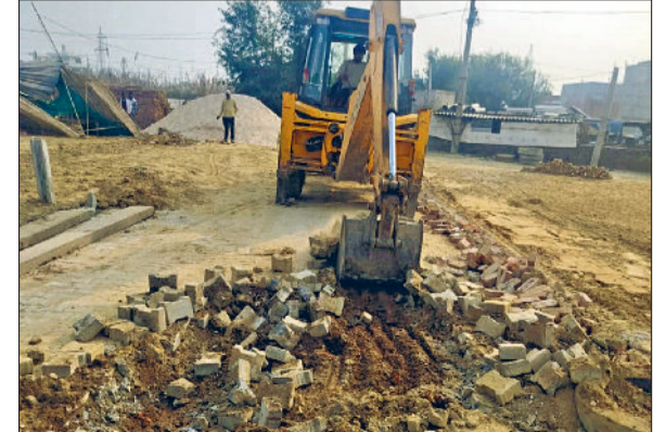
बहादुरगढ़। मामन विहार के निकट अवैध कॉलोनी में तोड़फोड़ करती नप की जेसीबी।