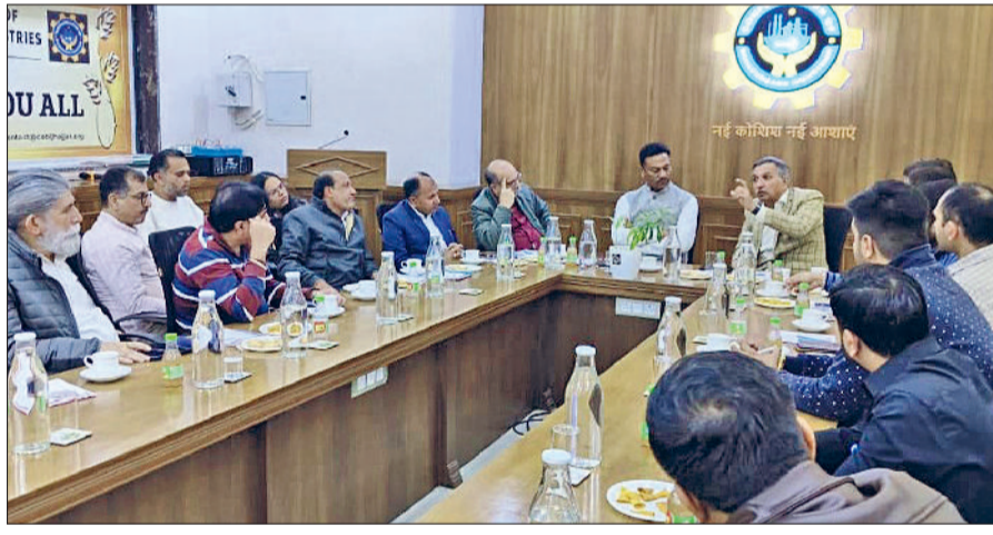
बहादुरगढ़। बैठक में बिजली निगम अधिकारियों से चर्चा करते कोबी सदस्य।