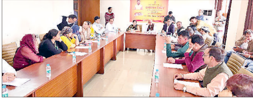
झज्जर। नप हाउस की बैठक में विकास के मुद्दों पर चर्चा करते हुए नप चेयरमैन, विभागीय अधिकारी और पार्षद।