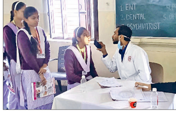
बहादुरगढ़। कैप में विद्यार्थियों का स्वास्थ्य जांचते चिकित्सक।