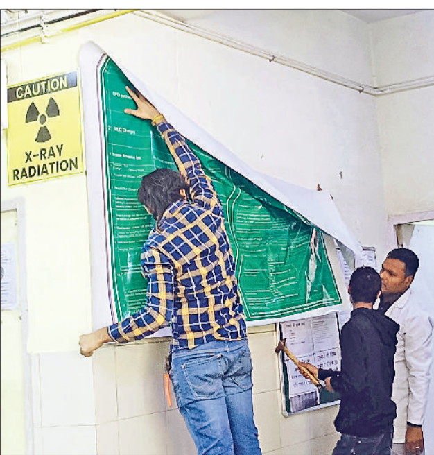
बहादुरगढ़। अस्पताल में पुराना हटाकर नया पोस्टर लगाते कर्मचारी।

नागरिक अस्पताल परिसर में राष्ट्रीय मूल्यांकन टीम का दौरा बुधवार को भी जारी रहा। लगातार तीसरे दिन अस्पताल परिसर में भागदौड़ भरा माहौल देखने को मिला। कुछ देर के लिए तो ट्रामा सेंटर में माहौल गरमा गया। दरअसल, ट्रामा सेंटर में ड्यूटी पर तैनात एक चिकित्सक जब अपने रूम में काम कर रहे थे तो इस दौरान टीम वहां गई। टीम ने वहां कार्रवाई शुरू की तो ड्यूटी पर तैनात डॉक्टर को दूसरी जगह काम करने के लिए कह दिया गया। इस पर डॉक्टर ने आपत्ति जताई और गुस्सा जाहिर करते हुए कहा कि इस तरह से काम कैसे चलेगा। वहीं, मौके पर मौजूद मरीजों ने चिकित्सक की आपत्ति को सही मानते हुए कहा कि इमरजेंसी में व्यवस्था दुरुस्त होनी चाहिए। हालांकि इस दौरान ज्यादा काम प्रभावित नहीं हुआ। टीम के जाते ही डॉक्टर ने अपना काम चालू किया।