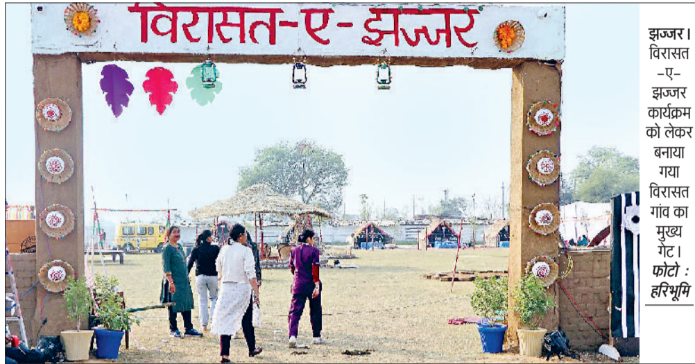
झज्जर। विरासत-ए-झज्जर कार्यक्रम को लेकर बनाया गया विरासत गांव का मुख्य गेट।

महोत्सव में जहां 14 से 17 आयु वर्ग के युवा लोक-नृत्य, लोक-गायन, सगनी, समूह गान और देसी कला की प्रस्तुति देंगे वहीं उनके लिए रस्साकस्सी, पिट्टू, कबड्डी, कुश्ती और मलखंब जैसे पारंपरिक खेलों का आयोजन भी किया जाएगा