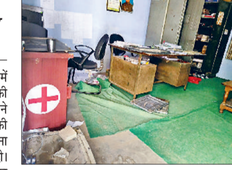
झज्जर। कमरे में खुली हुई अलमारियां, जिनसे चोरी हुआ सामान।