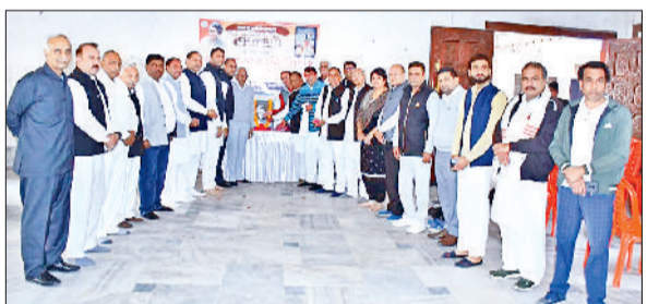
झज्जर। पूर्व प्रधानमंत्री स्वर्गीय इंदिरागांधी को श्रद्धांजलि देते हुए कांग्रेस कार्यकर्ता।