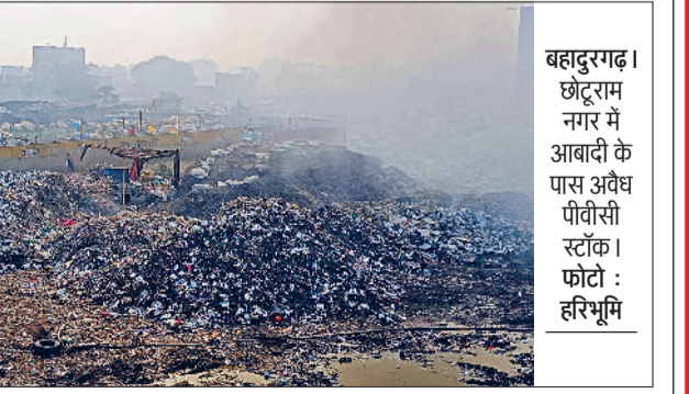
बहादुरगढ़। छोटराम नगर में आबादी के पास अवैध पीवीसी स्टॉक।

हरिभूमि न्यूज झज्जर। छोटराम नगर स्थित पीवीसी स्क्रेप के ढेर में लगी आग अभी तक पूरी तरह से नहीं बुझ पाई है। कहीं कहीं मलबे के अंदर आग धधक रही है। कबाड़ से लगातार उठ रहा धुआं वातावरण में जहर घोल रहा है। आसपास रहने वाले लोग परेशान हैं। बच्चों और बुजुर्गों को अधिक मुश्किल हो रही है। दरअसल, कुछ वर्षों पहले दिल्ली में प्रतिबंध लगाने के बाद प्लास्टिक स्क्रेप व्यापारियों ने बहादुरगढ़ का रुख किया था। धीरे-धीरे शहरी क्षेत्र के साथ-साथ कई गांव भी इन प्लास्टिक कचरे के गोदामों की चपेट में आ गए। न केवल कृषि भूमि बल्कि रिहायशी बस्तियों में भी कचरे के गोदामों की भरमार है। छोटराम नगर में तो मेन रोड तथा मकानों के ठीक साथ स्क्रेप स्टॉक बने हैं। अक्सर इन स्टॉक में आग लग जाती है। जिससे वातावरण तो दूषित होता ही है, आम नागरिकों को भी मुश्किलें उठानी पड़ती हैं। वहीं, इन स्टॉक पर रहने वाले