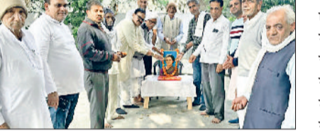
बहादुरगढ़। इंदिरा गांधी के चित्र पर पुष्प अर्पित करते कांग्रेसी।