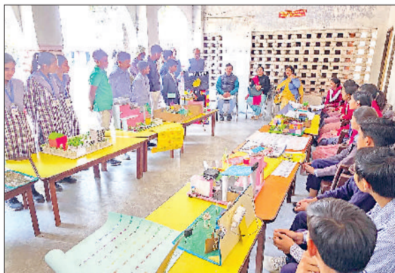
झज्जर। बाल वैज्ञानिक प्रदर्शनी में मॉडल प्रदर्शित करते हुए विद्यार्थी।